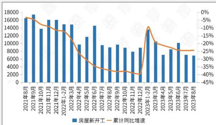
图：房地产开发企业新开工面积月度走势