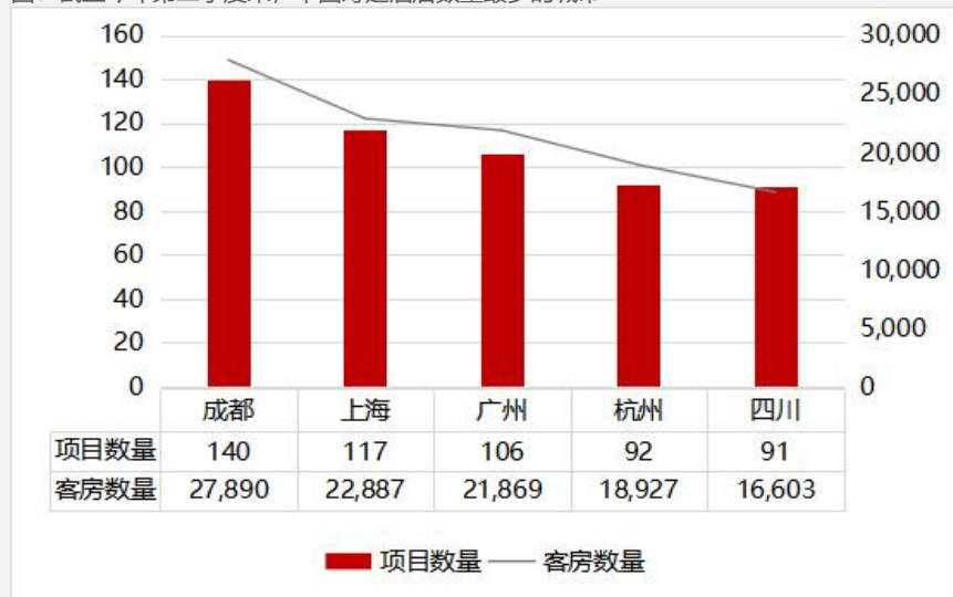
图：截至今年第二季度末，中国筹建酒店数量最多的城市

据Lodging Econometrics调研报告显示，今年第二季度，中国地区筹建中的酒店项目有3666个，约67.9万间客房，居世界第二。中国筹建酒店数量最多的城市是四川省会成都，有140个项目、接近2.79万间客房。 2023年下半年预计还将有591家新酒店开业，超8.58万间客房。